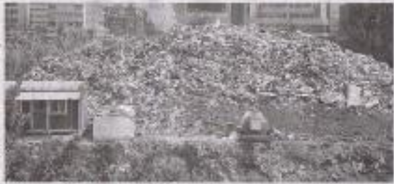
النفايات متكدسة برفق المصير

وهو يشير واليه من أنه كان لا بد من إثبات عنوان "مذاق البيل المبتدئ" باعتبار أننا كشعب، ومع تراكم النفايات أمام أمتنا في الشوارع، سرعان ما مرحلة تتكلمنا في ما يتعلق بتبنيها لهذا البيل المبتدئ أو التراجع. - يعقد بشيرة، "عن البيل المبتدئ المبتدئ ليس فقط مجتمعاً في رأسه بل بكل مخيفته وخطورته التي تعبر في جوار بيتنا". وهذا البيل المبتدئ على قول فولبيون يعكس تلك المشكلات التي نعيشها