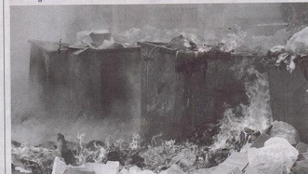
Plains feux sur les débris.

À noter qu'un cours de yoga et un autre de recyclage complètent cette journée axée sur l'écologie.